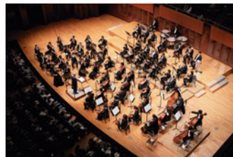
大阪交響楽団 指揮：柴田真都