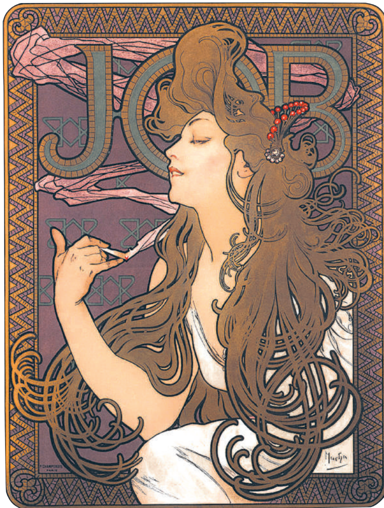
アルフォンス・ミュシャ ジョブ (1896年) 1896年 リトグラフ、紙