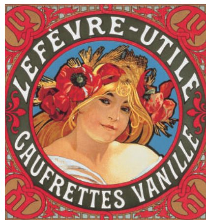
アルフォンス・ミュシャ ゴーフレット・ラベル: ルフエヴル＝ユティール 1899年 リトグラフ、紙

誰もが目にすることのできる街頭のポスターは「巷の芸術」と呼ばれ、当時のライフスタイルや流行、文化、思想、価値観などの社会の姿を映し出していました。ポスター黄金期のパリに関していえば、ポスターのある街並み、あるいはポスターそのものが、その時代の象徴だったとも言えるでしょう。(A.O.)