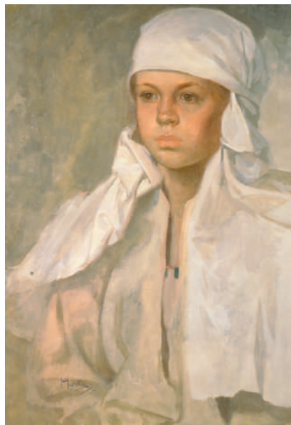
アルフォンス・ミュシャ スラヴの民族衣装を着た少女: 《スラヴ叙事詩》のための習作 1911年 油彩、カンヴァス

それでもミュシャはパリに留まります。この選択が、やがて女優サラ・ベルナルとの出会いにつながり、装飾芸術家として名を成す大きなチャンスに彼にもたらすことになりました。当時、アカデミーやサロンといった美術制度のもとで活動する画家と、商業美術や装飾を手がける作家の間には明確な線引きがありました。図らずも後者の領域で名前が知られるようになったミュシャでしたが、伝統的な絵画表現を保持しつつ、当時流行していた芸術様式アール・ヌーヴォーの要素も画面に取り入れ、人気と仕事を得意にいきます。