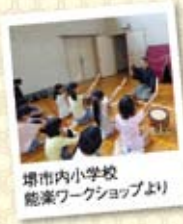
堺市内小学校 能楽ワークショップより