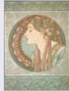
アルフォンス・ミュシャ 『月桂樹』 1901年 リトグラフ、紙 堺市蔵

○ミュージアムトーク 日時:8月2日(土)、8月16日(土)、8月30日(土)、9月14日(日) 各日14:00~(30分程度) ミュシャ館受付前集合 予約・参加費:不要(観覧料のみ別途要)