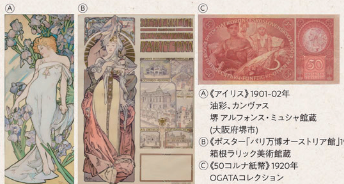
A 《アイリス》1901-02年 油彩、カンヴァス 堺 アルフォンス・ミュシャ館蔵 (大阪府堺市) B 《ポスター「パリ万博オーストリア館」1900年》箱根ラリック美術館蔵 C 《50コルナ紙幣》1920年 OGATAコレクション

参加希望者名(フリガナ要)・年齢・人数(イベント1は付添の人数も)・住所・電話番号・イベント名・日時(イベント1は希望の時間帯も)を明記して、往復はがき、FAXまたはメール(mucho@sakai-bunshin.com)にて、堺 アルフォンス・ミュシャ館までお申し込みください。※電話でのお申し込み不可。