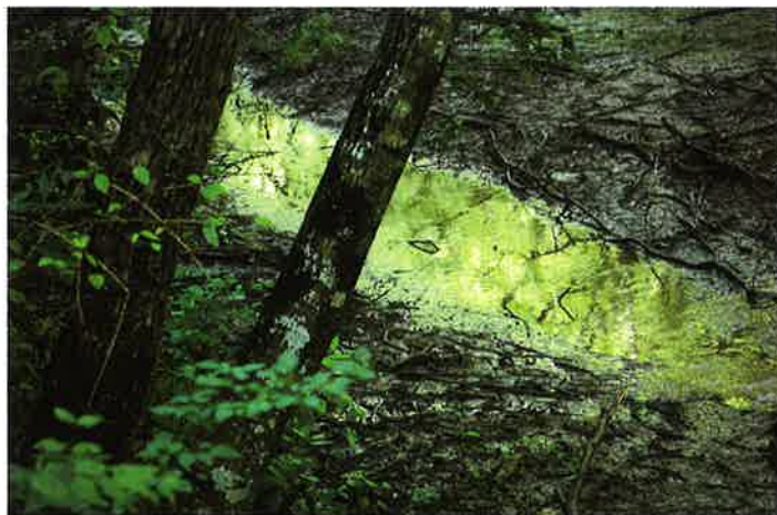
高橋美保「狭山湿地をゆく」優秀賞