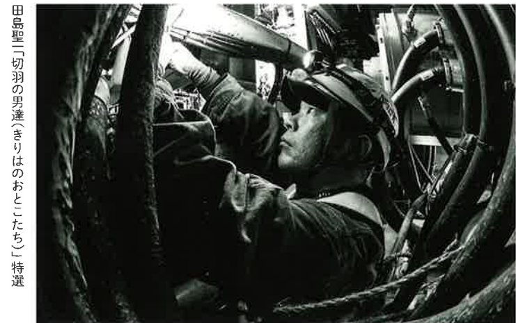
田島聖「切羽の男達(きりはのおとたち)」特選