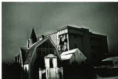
久保村 厚「秋の幻」特選