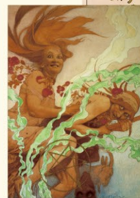
5.《ハロウィン:『ハースト誌』表紙(下絵)》1921年 水彩、鉛筆、紙