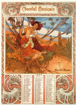
1.《カレンダー1898年4月-6月:ショコラ・メキシカン》1898年 リトグラフ、紙