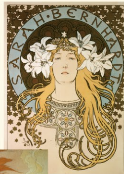
4.《サラ・ベルナル》1896年 リトグラフ、紙