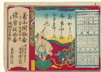
6.《萬小間物處并ニ袋物提物品々 小問源こと立花源二郎》1882年 木版、紙 堺市立中央図書館蔵

1.3.4.5は全てアルフォンス・ミュシャ作、堺 アルフォンス ミュシャ館(堺市)蔵