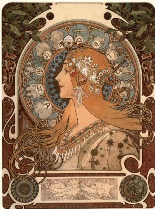
3.《黄道十二宮》1896年 リトグラフ、紙