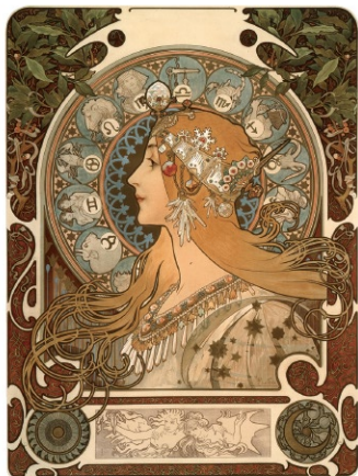
《黄道十二宮》1896年 リトグラフ、紙 Zodiac (1896), lithograph on paper

19世紀末のパリにて、ミュシャが手がけたカランドリエ(暦)の数々を一挙に公開します。さらに春夏秋冬にまつわる作品を、ミュシャの生涯における重要な日に焦点を当てながら、12の月の流れに沿って紹介します。多彩なアール・ヌーヴォーの暦の世界をご堪能ください。