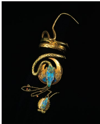
《蛇のブレスレットと指輪》1899年 金、エナメル、オパール、ダイヤモンド Snake Bracelet with a Ring (1899), gold, enamel, opal and diamond

ミュシャは版画、絵画、彫刻、書籍など、様々な技法で自らの芸術を表現した総合芸術家です。この“博覧会”では、ミュシャのマルチなアートワークを、ジャンルごとに大公開。子どもから大人まで、ミュシャ初体験の方からファンの方まで楽しめる展示とプログラムを展開します。