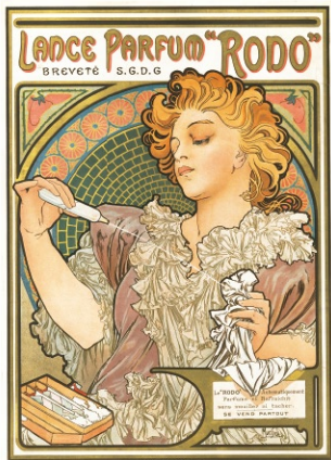
《ランスの香水「ロド」》1896年 リトグラフ、紙 Lance Parfum Rodo (1896), lithograph on paper

《ジスモンダ》でポスター界にセンセーションをおこしたミュシャ。ミュシャが手掛けた商業美術に注目し、ポスター、パッケージ、書籍装幀や装飾資料集、それらの習作や下絵にいたるまでを幅広く紹介し、ミュシャ独自のデザイン論を紐解きながら“ミュシャスタイル”の秘密を探ります。