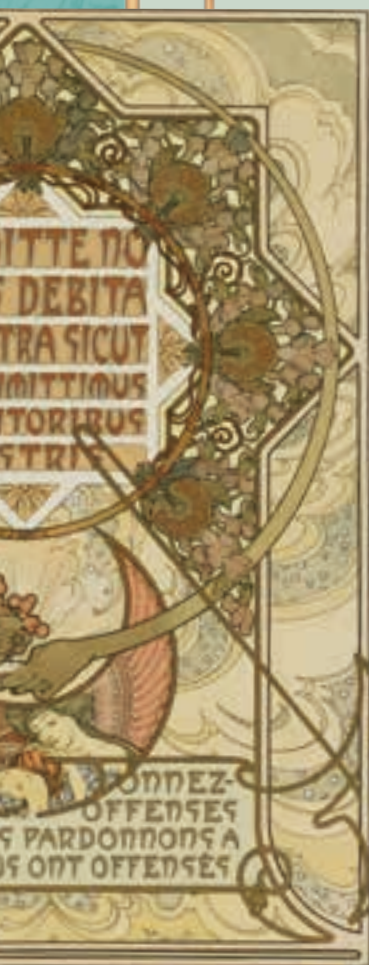
Illustration: The Drawings of Mucha and Art Nouveau